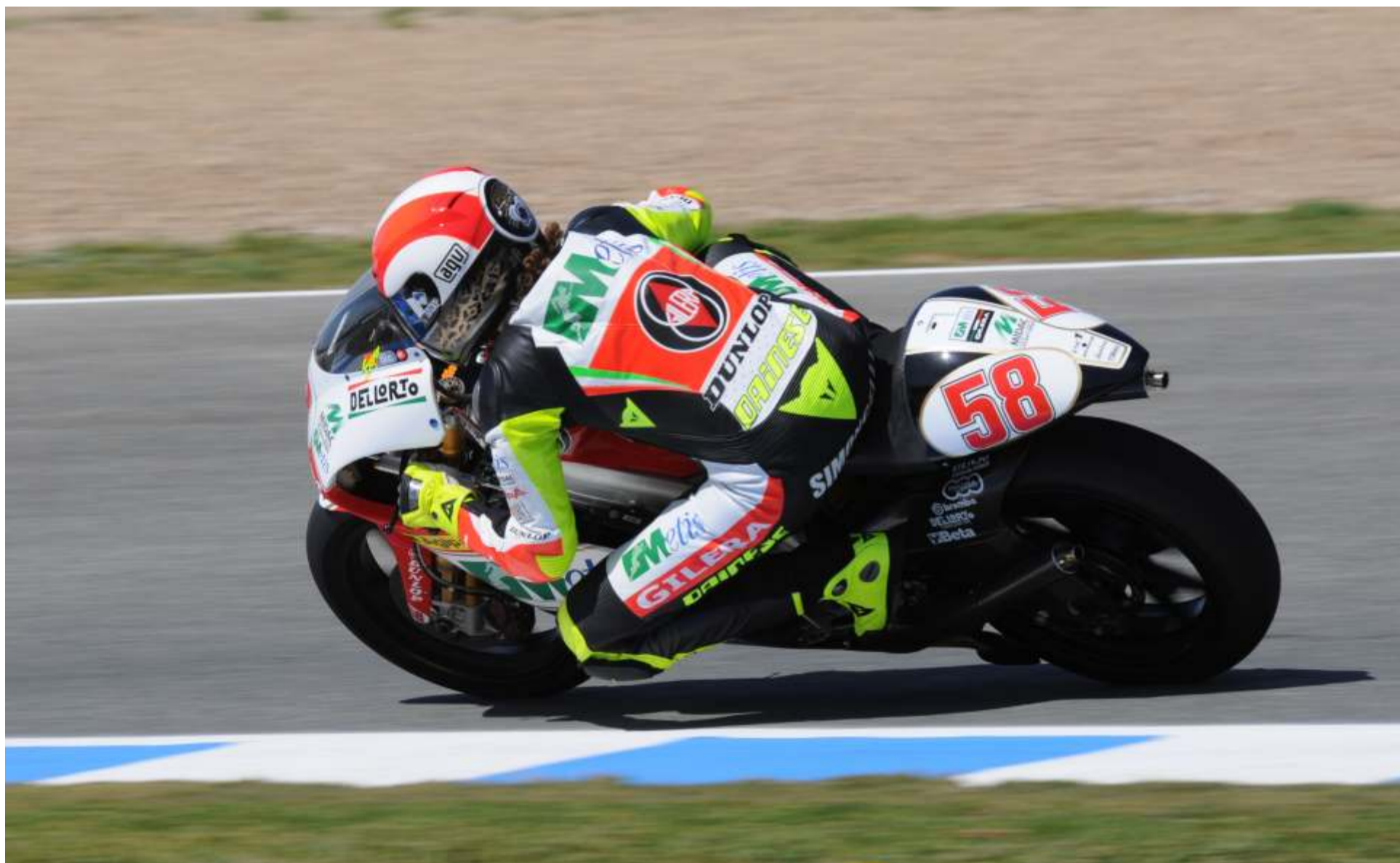
Marco Simoncelli demostró en Valencia quien es el campeón de 250 cc