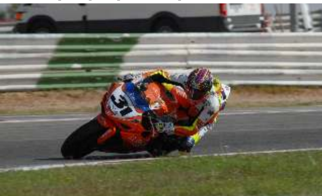
Carmelo Morales vencedor final de superstock 1000