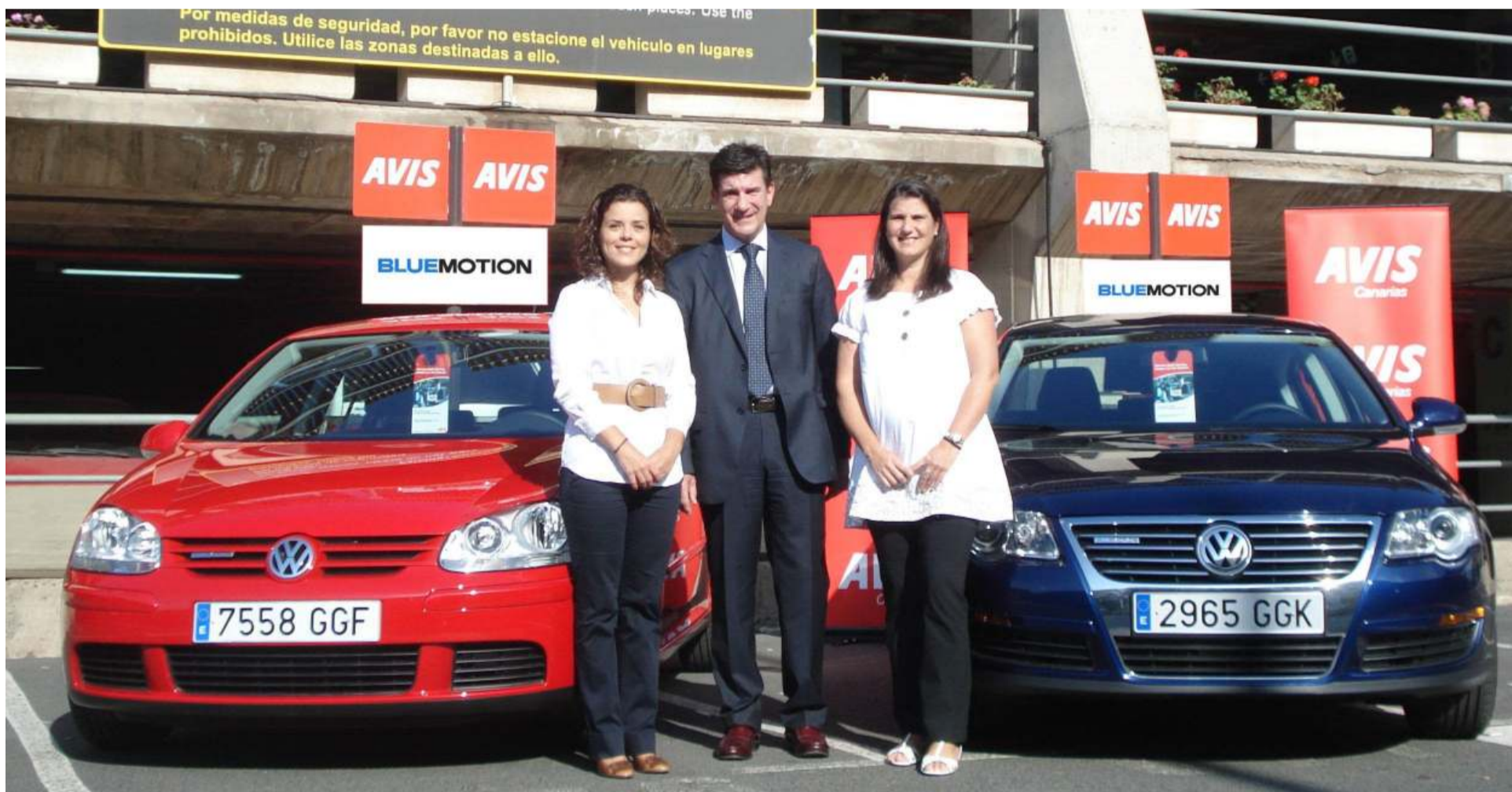
Disponer de la tecnología BlueMotion al alquilar un vehículo supone, de entrada, un ahorro asegurado de combustible.