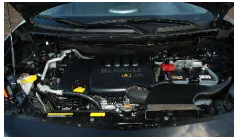
Motores de alto rendimiento y bajas emisiones de CO 2