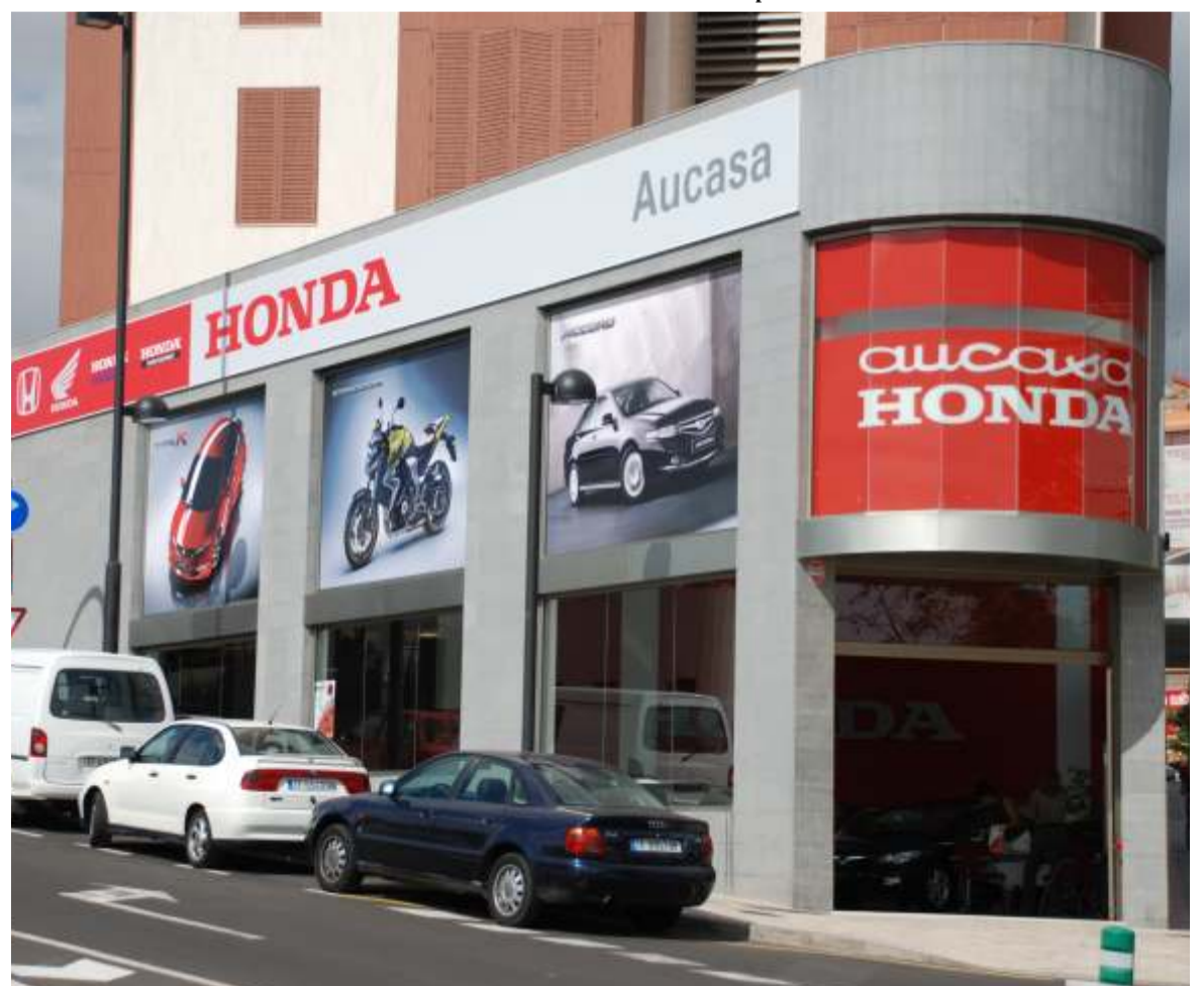
Unas instalaciones modernas en la zona con más futuro de nuestra capital