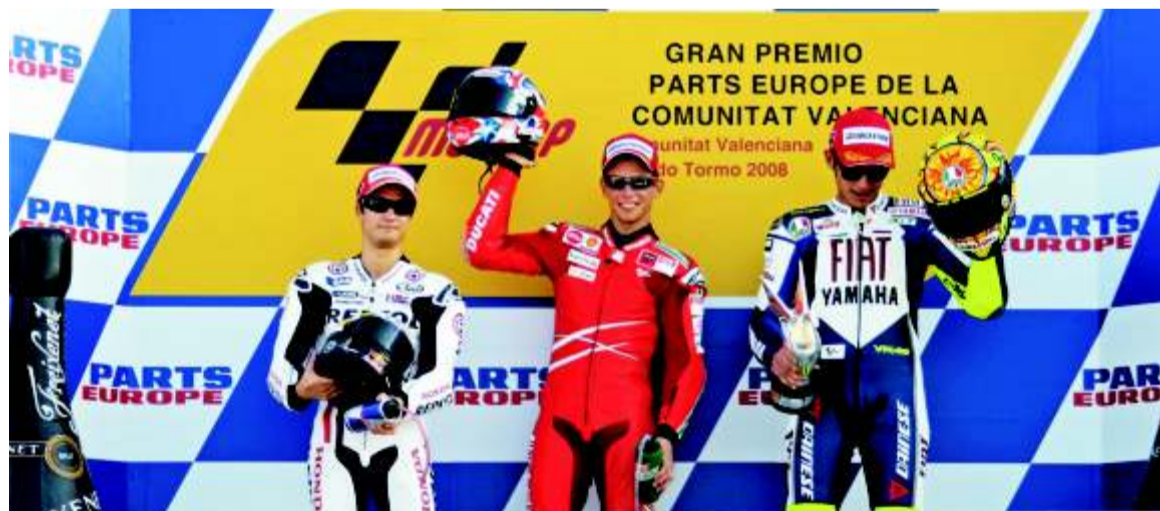
Dani Pedrosa, Casey Stoner y Valentino Rossi, anteriormente proclamado Campeón, en el podio de Moto GP