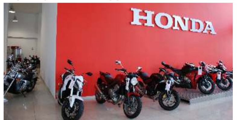
Las motos cuentan con un espacio importante en la exposición