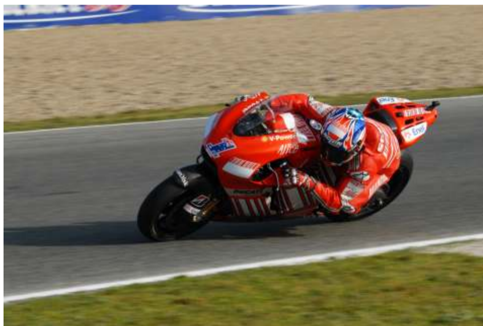
Casey Stoner volverá a su dorsal 27 la próxima temporada