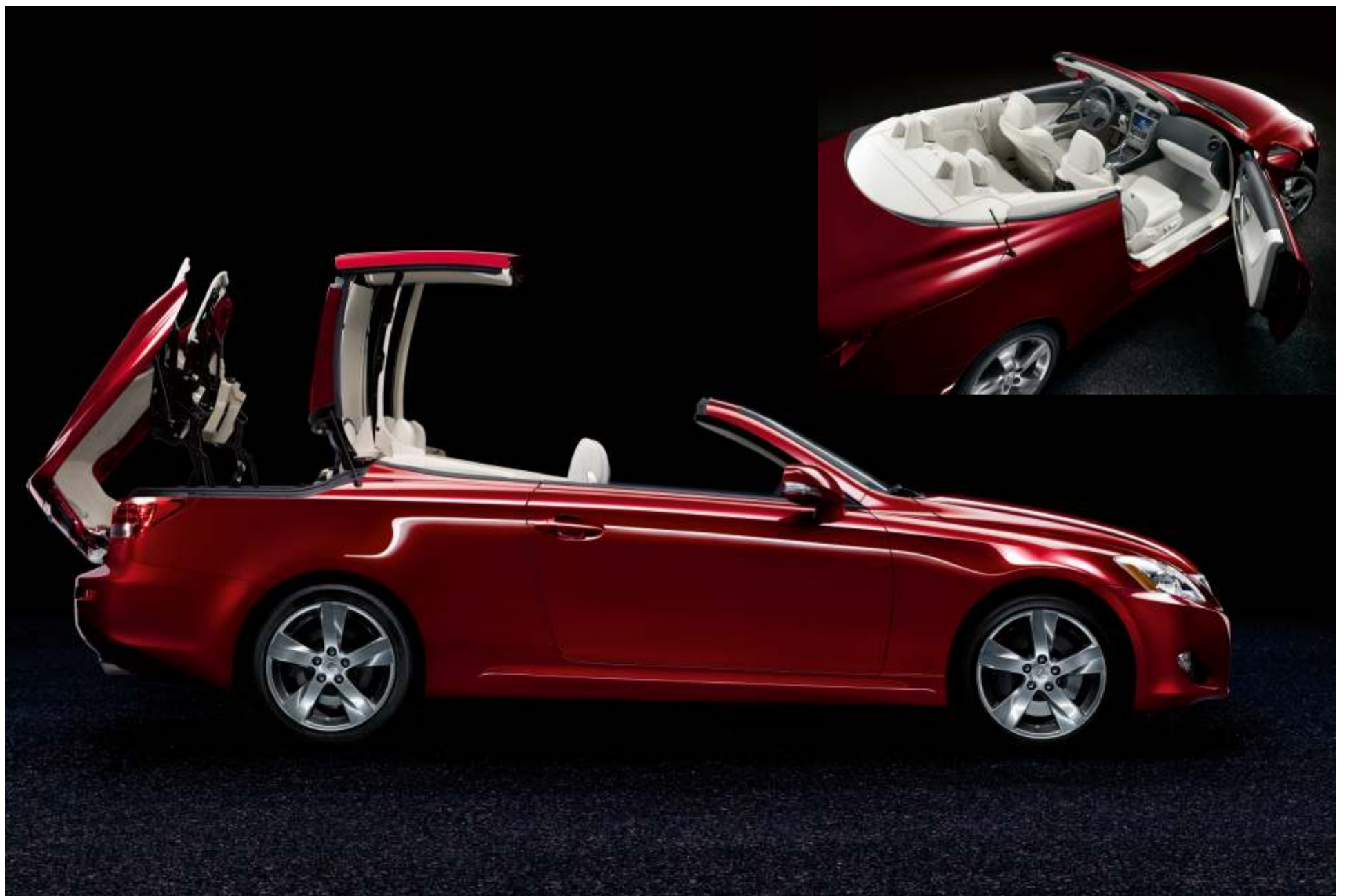
El carácter deportivo y potente de este descapotable viene caracterizado por su elegante y musculosa carrocería