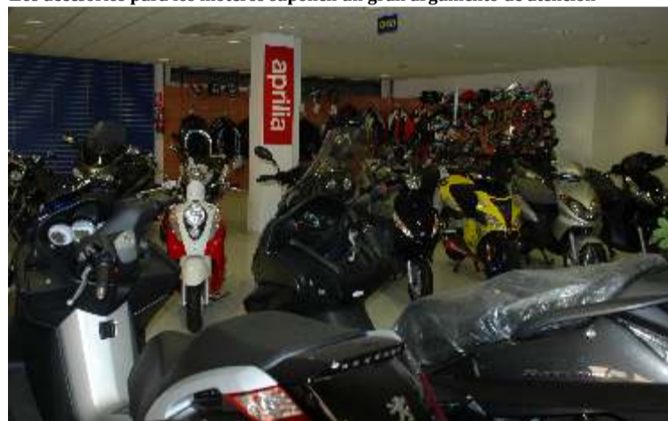
Muchos modelos de todas las marcas en relativo poco espacio

¡Hacemos ganar dinero a nuestros clientes!