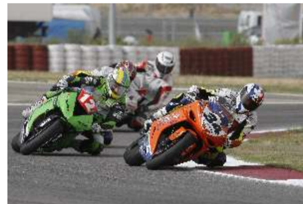
Del Amor que partía de la pole lideró más de la mitad de la prueba