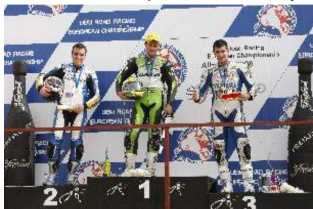
Podio de Superstock 1.000 jr. antes de la descalificación de Forés