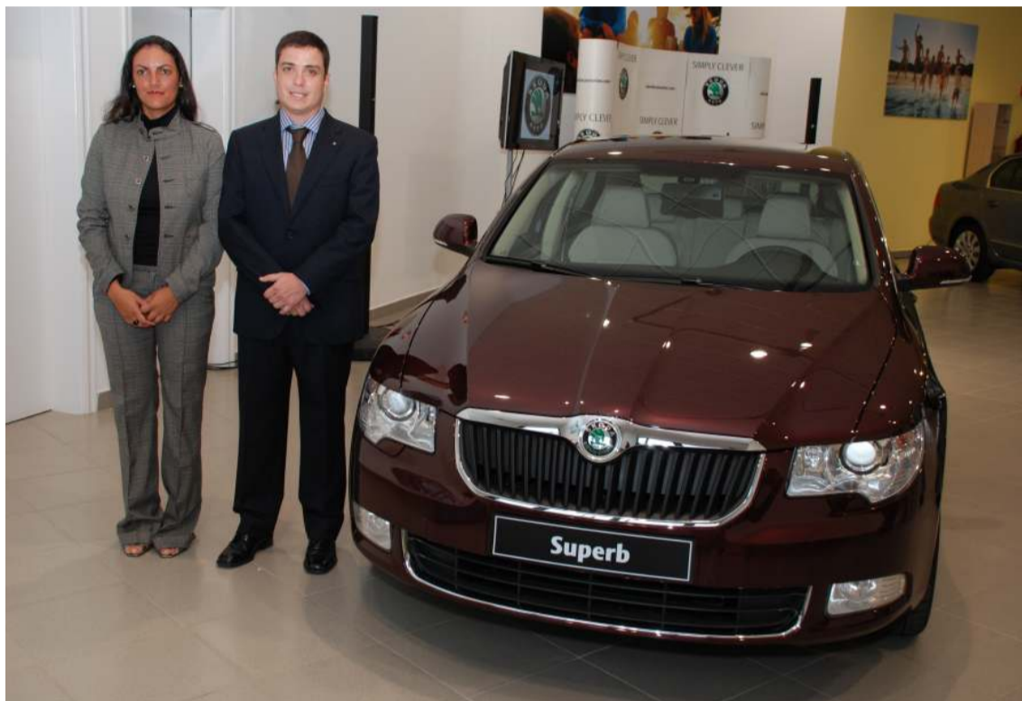
Responsables de Skoda Canarias posan junto al nuevo Skoda Superb