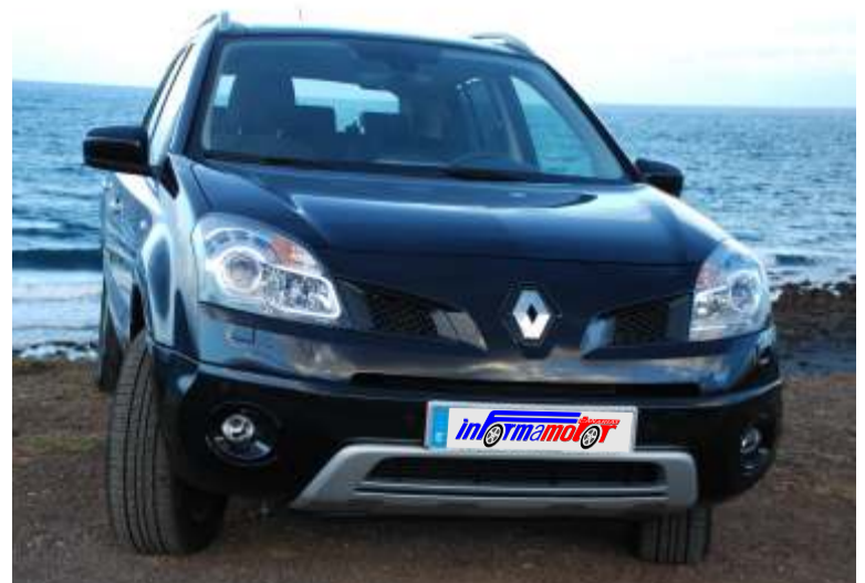
Tecnología, experiencia y conocimientos de Nissan All Mode 4x4-I