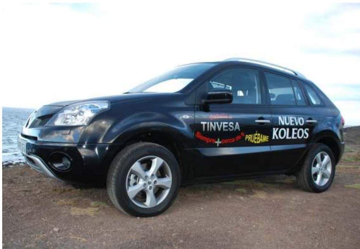
En el Crossover de Renault se percibe claramente la combinación de varios estilos de carrocería que lo hace único.