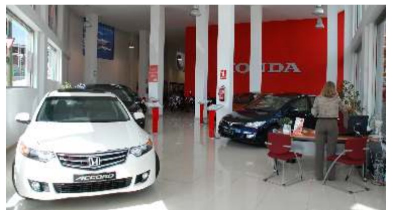
Al entrar nos encontramos con la exposición de automóviles