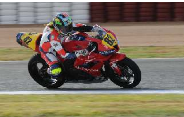
La española Elena Rossel arrasó en la carrera de mujeres