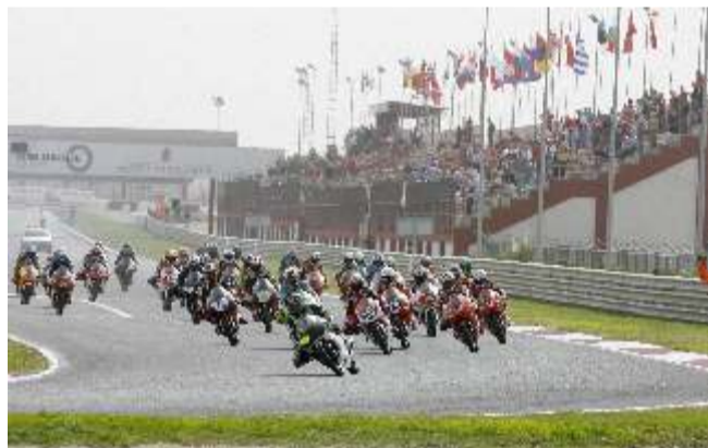
Salida de 125GP, única categoría sin donde no sonó el himno español