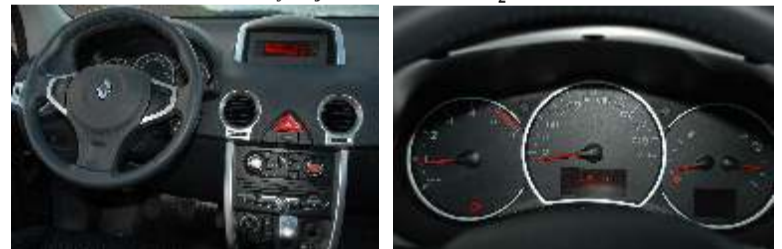
Equipamiento completo con un buen nivel de acabados