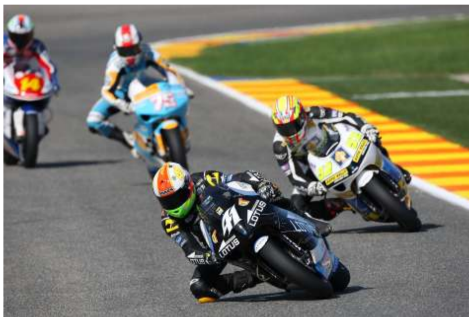
Aleix Espargaró completó su mejor temporada en 250 cc