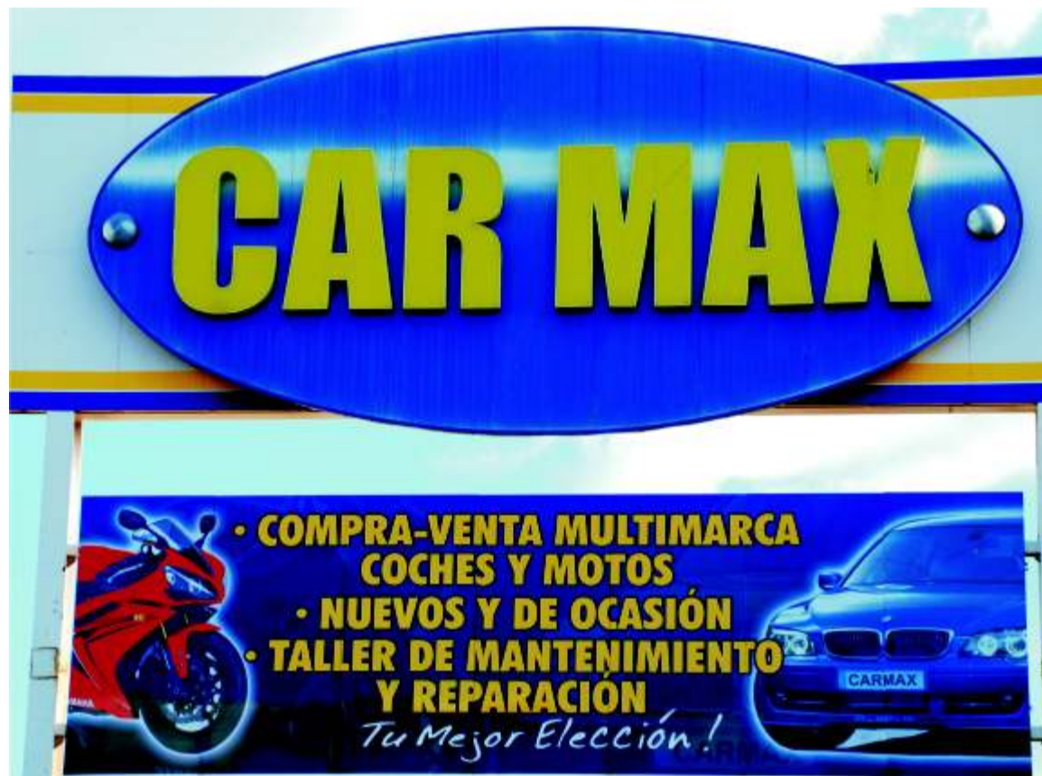
Un gran cartel con el logo de la empresa da paso a unas completas instalaciones pioneras como gran superficie de automoción