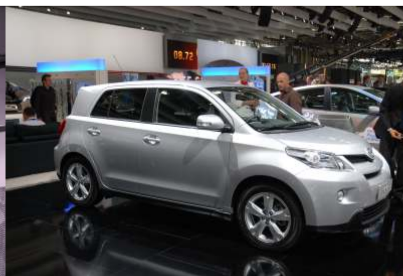
arriba: el Urban Cruiser TT urbano con un diseño exclusivo y robusto abajo: la nueva generación del Avensis diseñado y fabricado en Europa