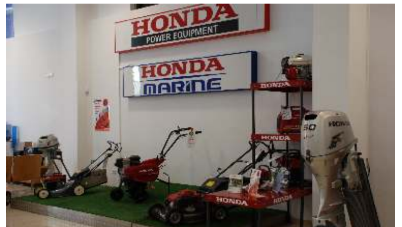
Completísima gama tanto en Power Equipment como en Marine