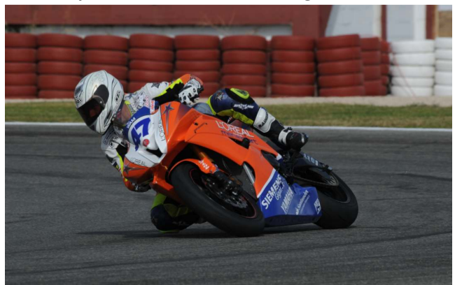
Rodri consigue el doblete: campeón de España y de Europa