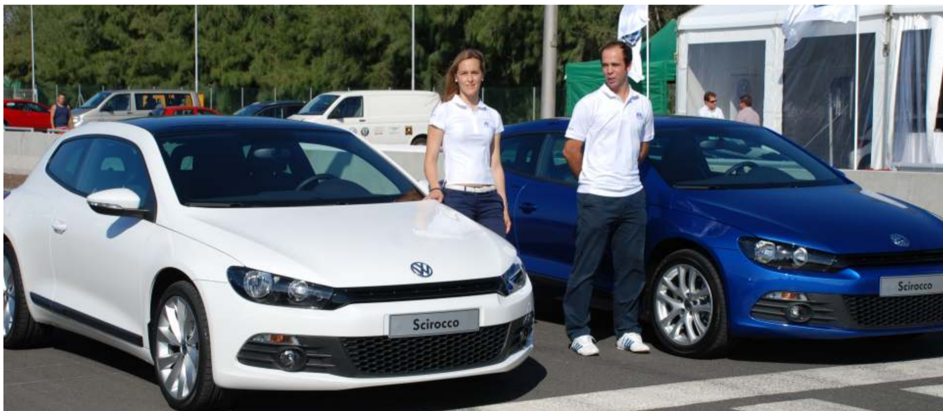
Responsables de Volkswagen Canarias posan entre los dos Scirocco en el circuito de Maspalomas donde los medios pudimos realizar pruebas dinámicas