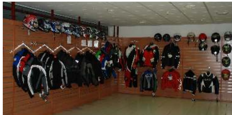
Los accesorios para los moteros suponen un gran argumento de atención